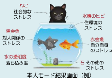
本人モード結果画面(例)